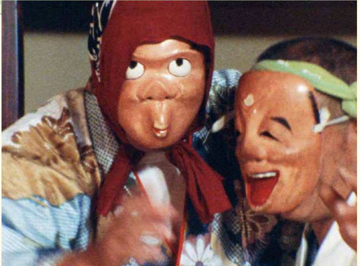
ふるさとあさおシリーズより①,②,③『石仏は語る』④,⑤『時を越えて 麻生に伝わる郷土芸能』