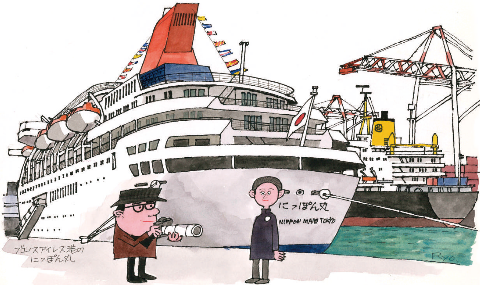
フェリスアイレス港の にっぽん丸