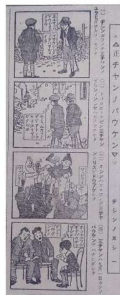
東京朝日新聞 「正チャンノバウケン」 作:織田小星、画:樺島勝一 1923(大正12)年10月20日

https://www.city.saitama.lg.jp/004/005/002/003/001/