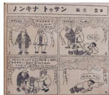
夕刊報知新聞 「ノンキナトウサン」 麻生豊 1924(大正13)年4月15日

オモテ面の画像はいずれも「時事漫画」日曜付録 (左上)1923(大正12)年10月7日 (右上)1929(昭和4)年1月13日 (真ん中)1929(昭和4)年2月24日 (左下)1926(大正15)年11月7日 (右下)1929(昭和4)年5月19日