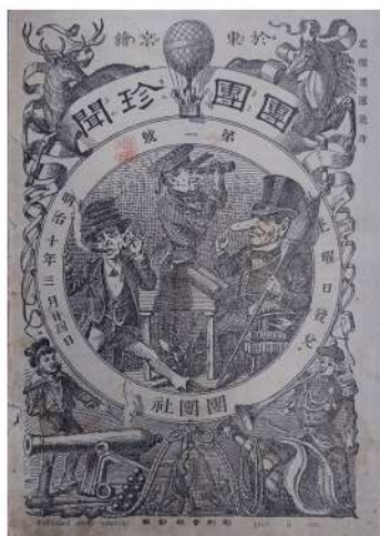
團圓珍聞(まるまるちんぶん) 第1号 1877(明治10)年3月24日